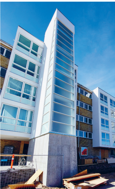
Det danske byggeboom skaber behov for faglært arbejdskraft. Alene Korsløkkeparkens renovering beløber sig til en milliard kroner.