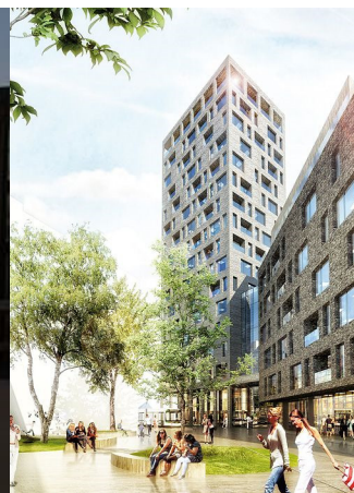
TBT Fra Gade til By