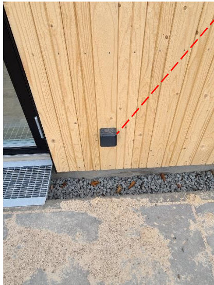
Udvendig stikkontakt på forsiden