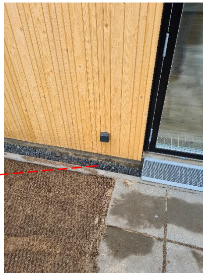
Udvendig stikkontakt på Bagsiden