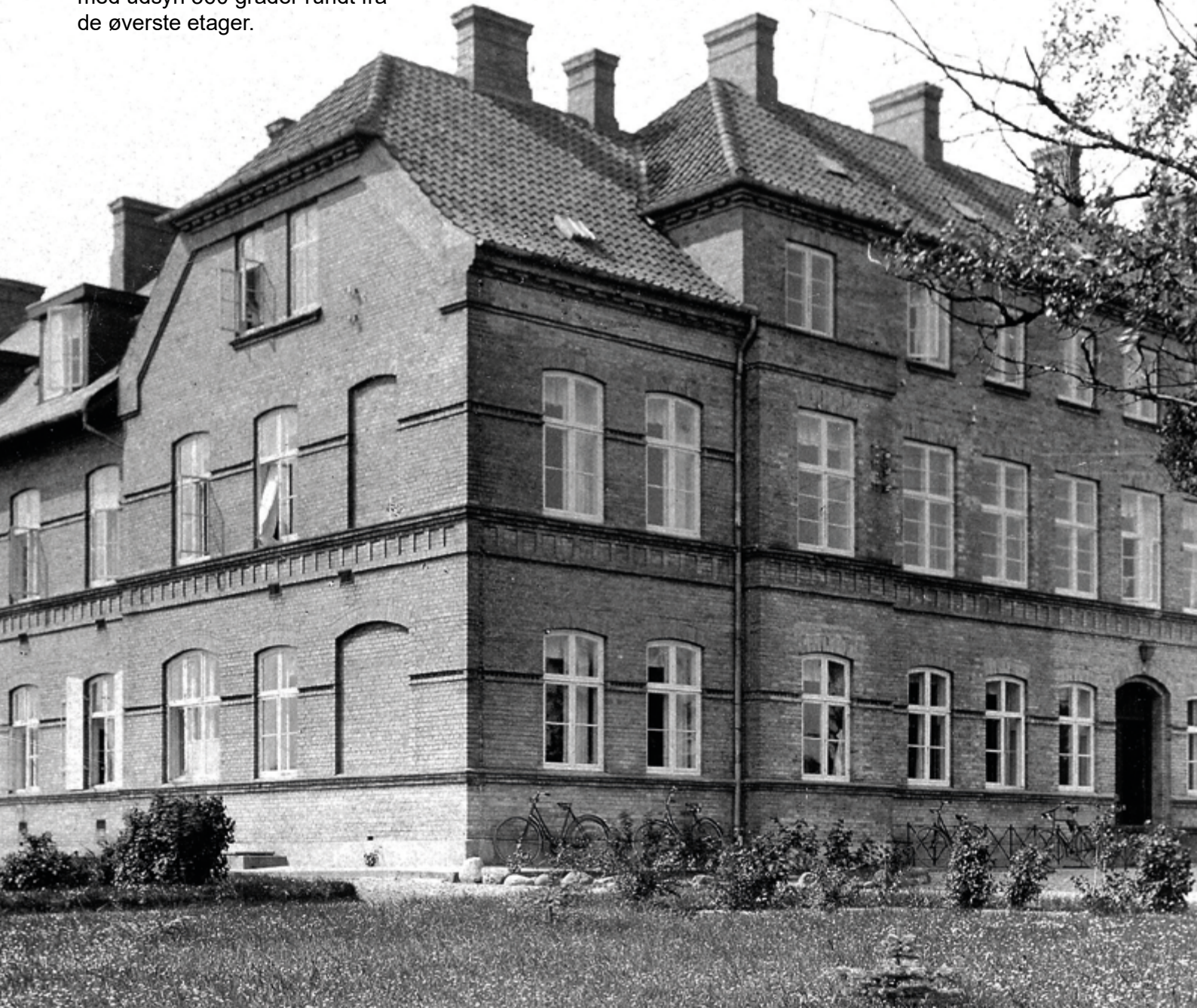
Faaborg Sygehus i 1930'erne

Faaborg Sygehus blev nedlagt i 2011 og har siden haft skiftende anvendelser. Området står i dag tomt og anvendes ikke.