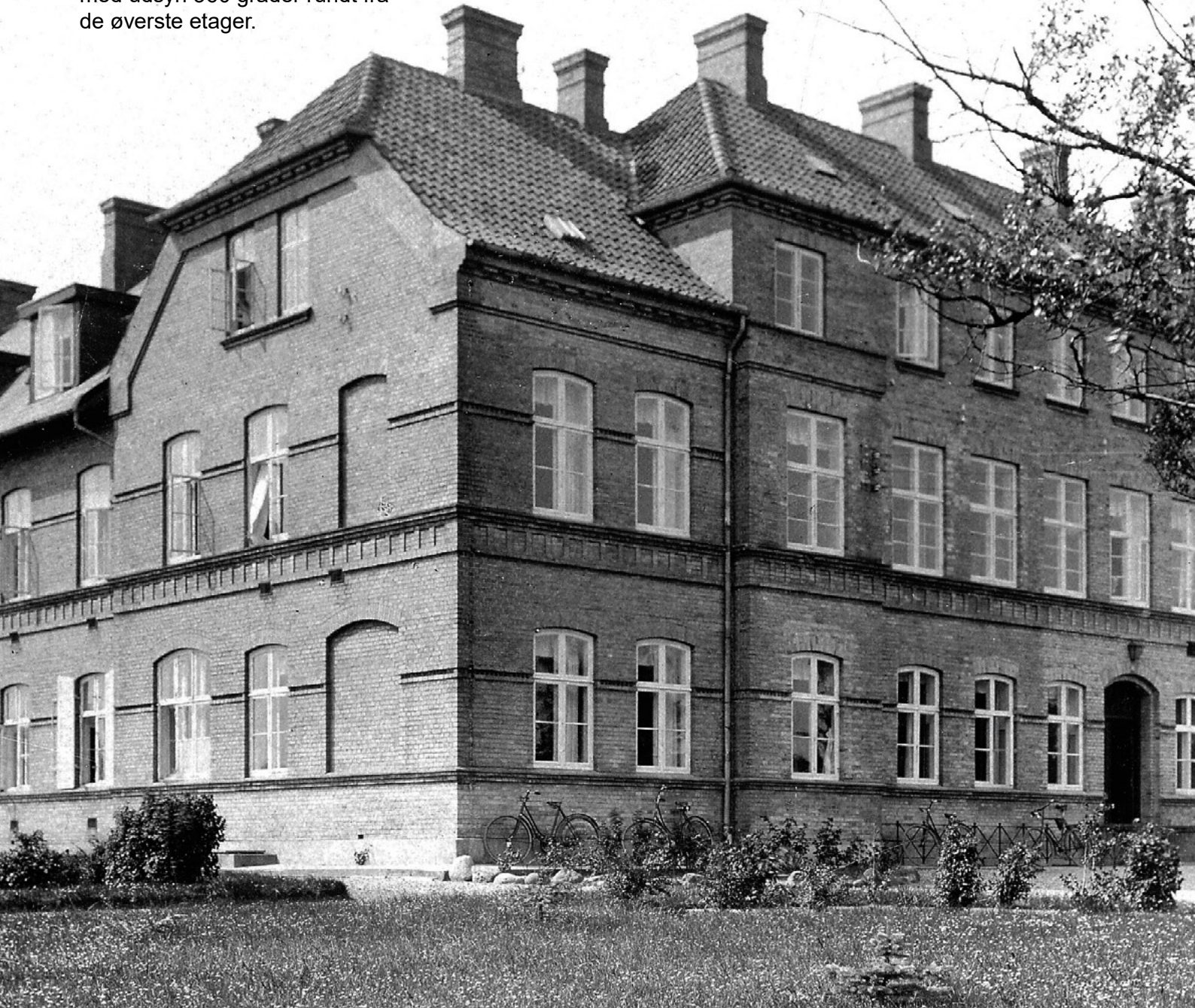
Faaborg Sygehus i 1930'erne

Faaborg Sygehus blev nedlagt i 2011 og har siden haft skiftende anvendelser. Området står i dag tomt og anvendes ikke.