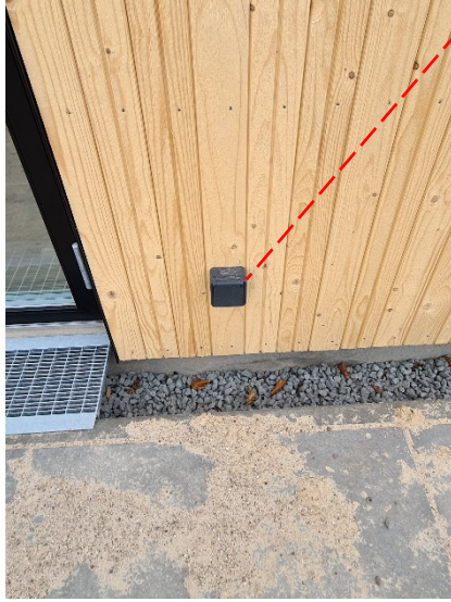
Udvendig stikkontakt på forsiden