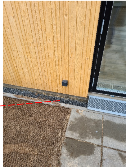
Udvendig stikkontakt på Bagsiden