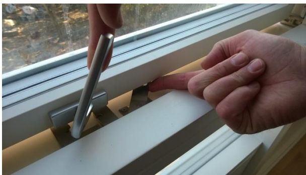
Sikkerhedslås slås fra.

For at slå sikkerhedslåsen fra, skal du først åbne vinduet til det går i hak og træk det ca. 1 cm tilbage igen. Før fingeren ind som vist på foto nedenfor og skub låsen ud og væk, så vinduet kan åbnes helt. Vinduet kan nu drejes hele vejen rundt, så du kan vaske det på den udvendige side. Når du har drejet det hele vejen rundt, går det i hak igen. Se foto nedenfor.