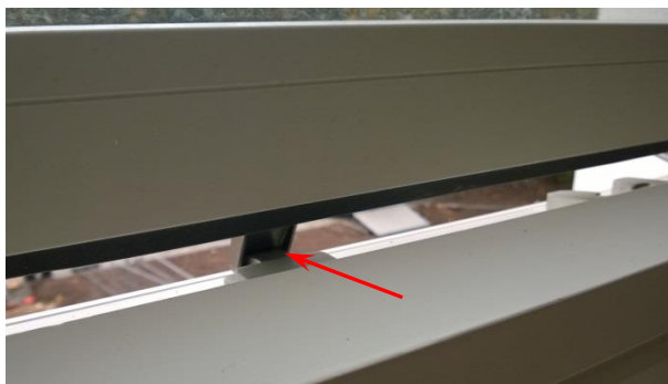
Låst når vinduet er drejet hele vejen rundt.